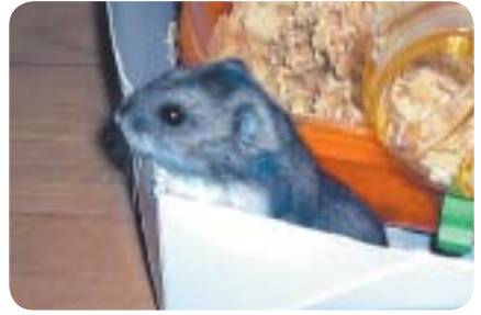
もも メス 1才