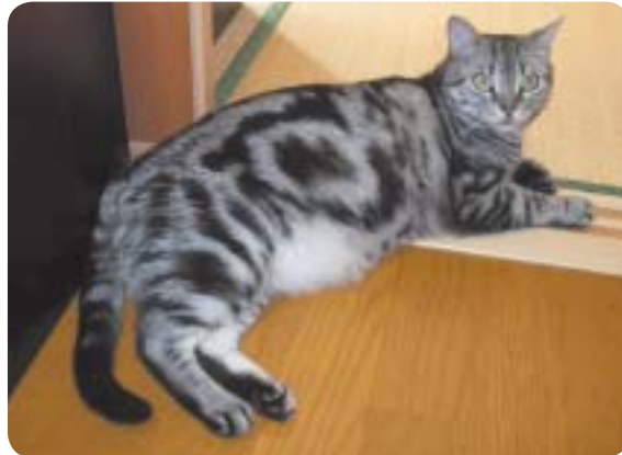
ミスにゃんこコンテストに出場予定のももちゃんです♡