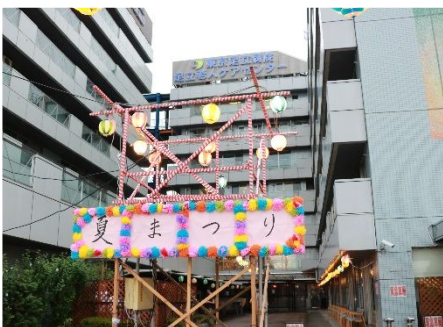
やぐらの準備もできていましたが、突然の雨で残念・・・