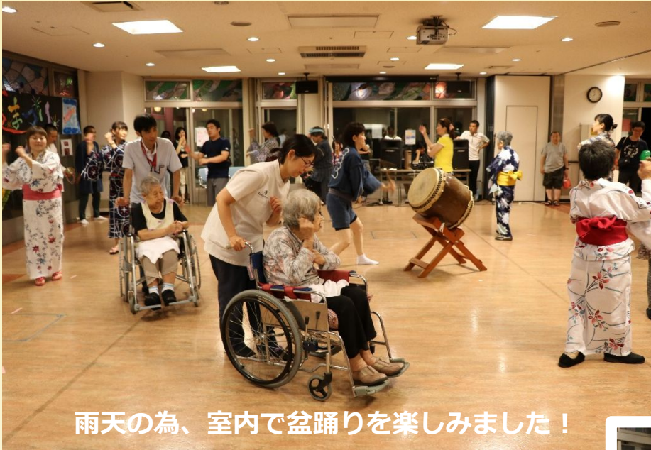
雨天の為、室内で盆踊りを楽しみました！