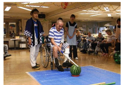
日中はスイカ割りを行い、皆さんに召し上がって頂きました。