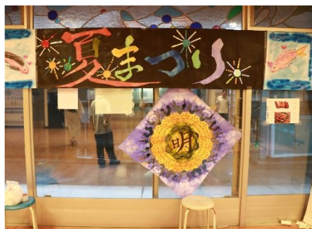
今年も立派な看板が出来上がりました。